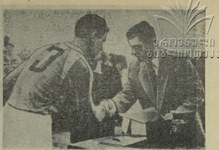
აკოპულარული ფახგურთელის სახელოვის თასი

მეორე ნახევარში თამაშს ფაქტიურად გამოეთიშა ქორდანი, შეტევამ დაკარგა სიმწვავე, რითაც კარგად ისარგებლეს მასპინძლებმა და კიდევ ორი გოლი გაიტანეს. მატჩი დამთავრდა ლენინაკანელთა გამარჯვებით ანგარიშით 3:0.