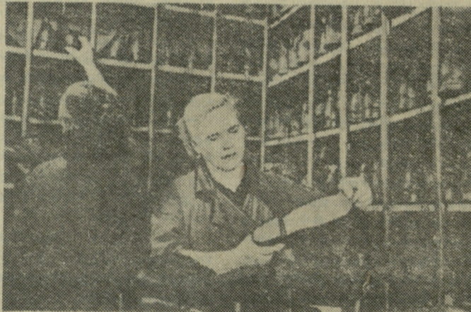
მოსკოვი. „სოკოლნიკის“ კულტურისა და დასვენების პარკის სათბილამურო ბაზა მზად შეხვდა ჯამთრის სეზონს. ბაზა მომსახურებას გაუწევს დასვენებულებს.

„მსაჯი პიკასოს სურათივით გამოიყურებოდა“ — აცხადებდნენ მეორე დღეს გაზეთები.