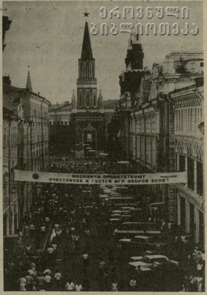
მოსკოვში ბრძალვება სპორტისა და ასალგაზრდობის ზეიმი — კეთილი ნების თამაშები