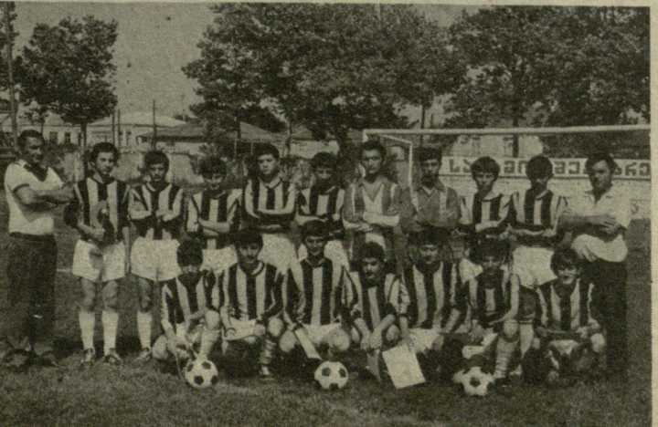
ფოთის „ვოლნიკის“ ფეხბურთელთა გუნდი.