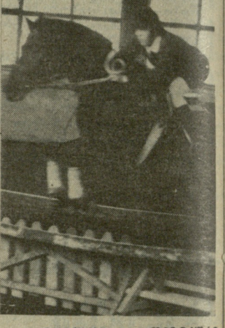
საპარტეზლოს ფიზიკური კულტურისა და სპორტის სახელმწიფო კომიტეტთან არსებული საცხენოსნო სპორტული ბაზა