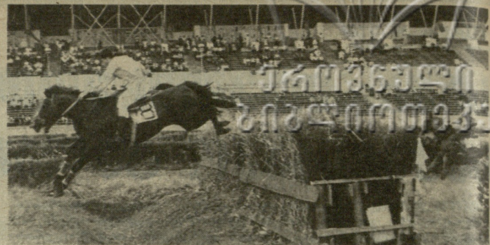
დღეს თბილისის სახელმწიფო იპოდრომზე ეწყობა განიარაღებისათვის მოქმედების კვირეულისადმი მიძღვნილი საცხენოსნო ხორტული წიმი. გამართება დილა, რბოლა, შეჯიბრებები და ხანგრძლივი გამოსვლები ცხენოსნობის კლასიკურ სახეობებში. პროგრამაში შედის აგრეთვე შეჯიბრება „სტილ-ჩეისში“. დასაწყისი 16 ს. 30 წ.

სხვა შეხვედრები ასე დამთავრდა: „პოლიტი“ (ნელაბინსკი) — „დინამო“ (ასტრახანი) 25:24 (15:13), „გრანიტასი“ (კუნასი) — სკიფ (კრასნოდარი) 23:20 (13:11). ჩემპიონატს მინსკის არმიელები და მოსკოვის საავიაციო ინსტიტუტის ხელბურთელები ლიდერობენ. 6-6 შეხვედრის შემდეგ მათ 10-10 ქულა აქვთ. მესამე ადგილზეა ცსკა — 9 ქულა. საქართველოს პოლიტექნიკური ინსტიტუტის გუნდს ქულა ჯერ არ აუღია. ტური 30 ოქტომბერს დამთავრდება.