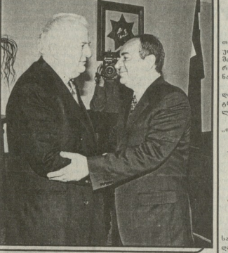
საქართველოს რეკონსტრუქციის კორპორაციის წევრი...