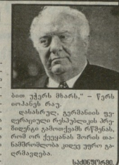
თბილისის მთავრობის წევრი...