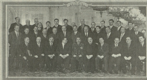
სსსრკ-ის კავშირის კონსტრუქციის პრაქტიკის 1964 წლის ოლიმპიური ჯგუფის წევრები

მედალიანი, რომ სურათების გამოკვეთება უფროა. ტელ: 99-66-10.