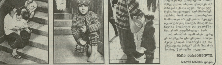
სტატიის ავტორი იხილავს მსგავსი სახის კვლევებს და განიხილავს მათსი შედეგებს.