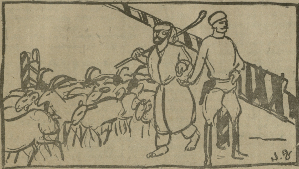
დარაჯი. დღიდან ღამიანა აქა ვდგევარ, საზღვარზე, ძილი არა მაქვს და მოსვენება, ასი თვალი მამია და აბა რა ჯანდაბა უნდა გამეზაროს ბათომისკენ.