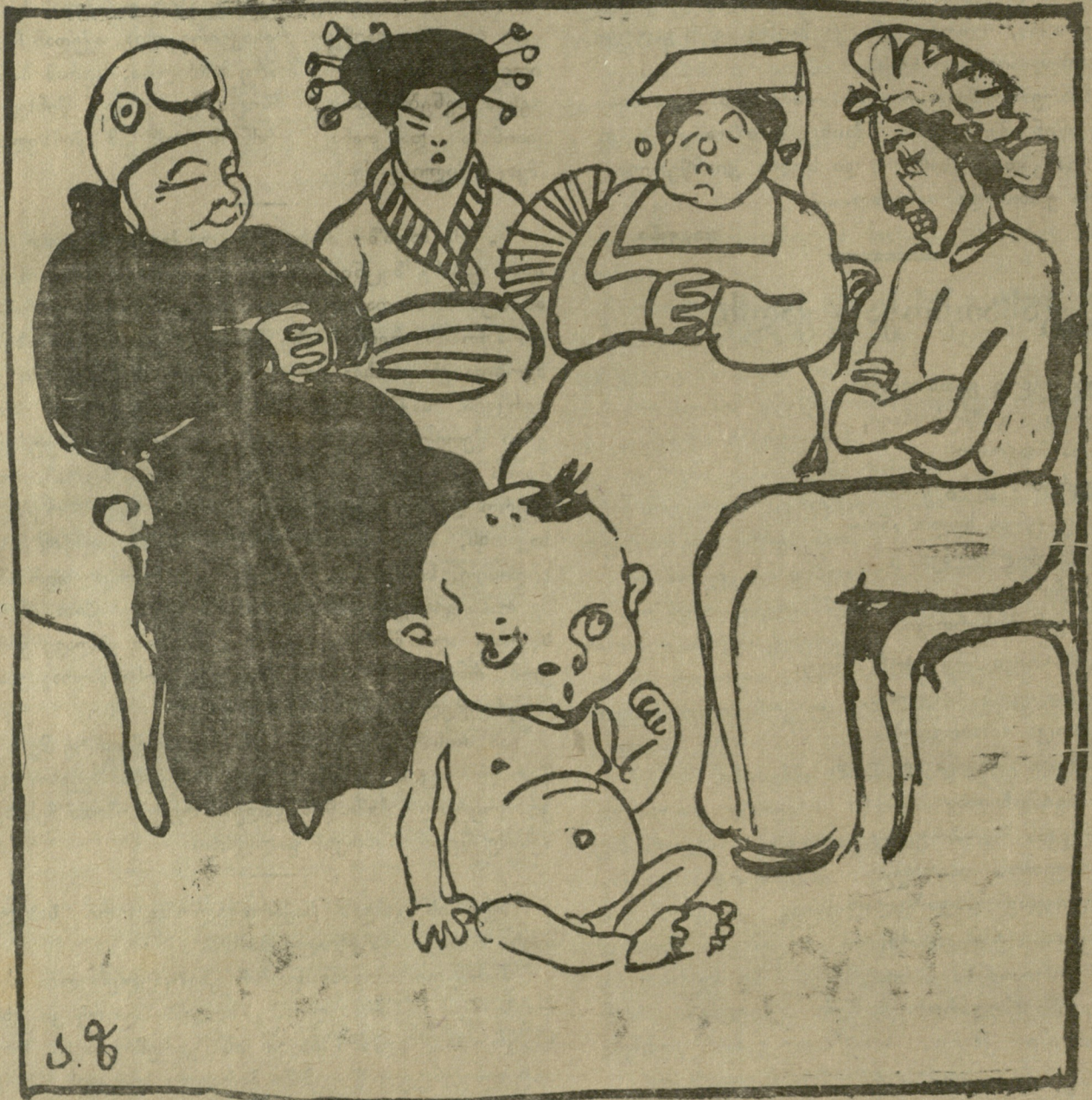
ანტანტის სახელმწიფოები. (ნახის სიყვარულით დასცქერიან ახლშობილ ზავს) რა კარგი ბიჭუკელაა, ამას კი ენაცვალოს მისი მშობლები!..

უმთავრესი ღირსება თამადისა, ზოგადი სიტყვით თუ აღვნიშნავთ, გახლავთ მადა ; მადა ჭამისა, მადა სმისა, მადა მხიარულებისა. აქედან ცხადია, რომ, რაც უფრო დიდი იქნებოდა ამა თუ იმ პიროვნების მადა, განსაკუთრებით კი მადა სმისა, მით უფრო სახელოვანი იქნებოდა თამადა. პირველ ყოვლისა ქართველი, ახლად ჩამოსული არარატის მთიდან და მის კალთებზე დასახლებული, ცდილობდა მოენახა რაიმე საგანი ამ დიდი მადის აღსანიშნავად. არავისთვის საკვირველი არ უნდა იყოს, თუ მისი ყურადღება მთამ მიიქცია, ვინაიდან ყველაფერზე დიდი ჩვენს გარშემო მხოლოდ „მთა“ არის.