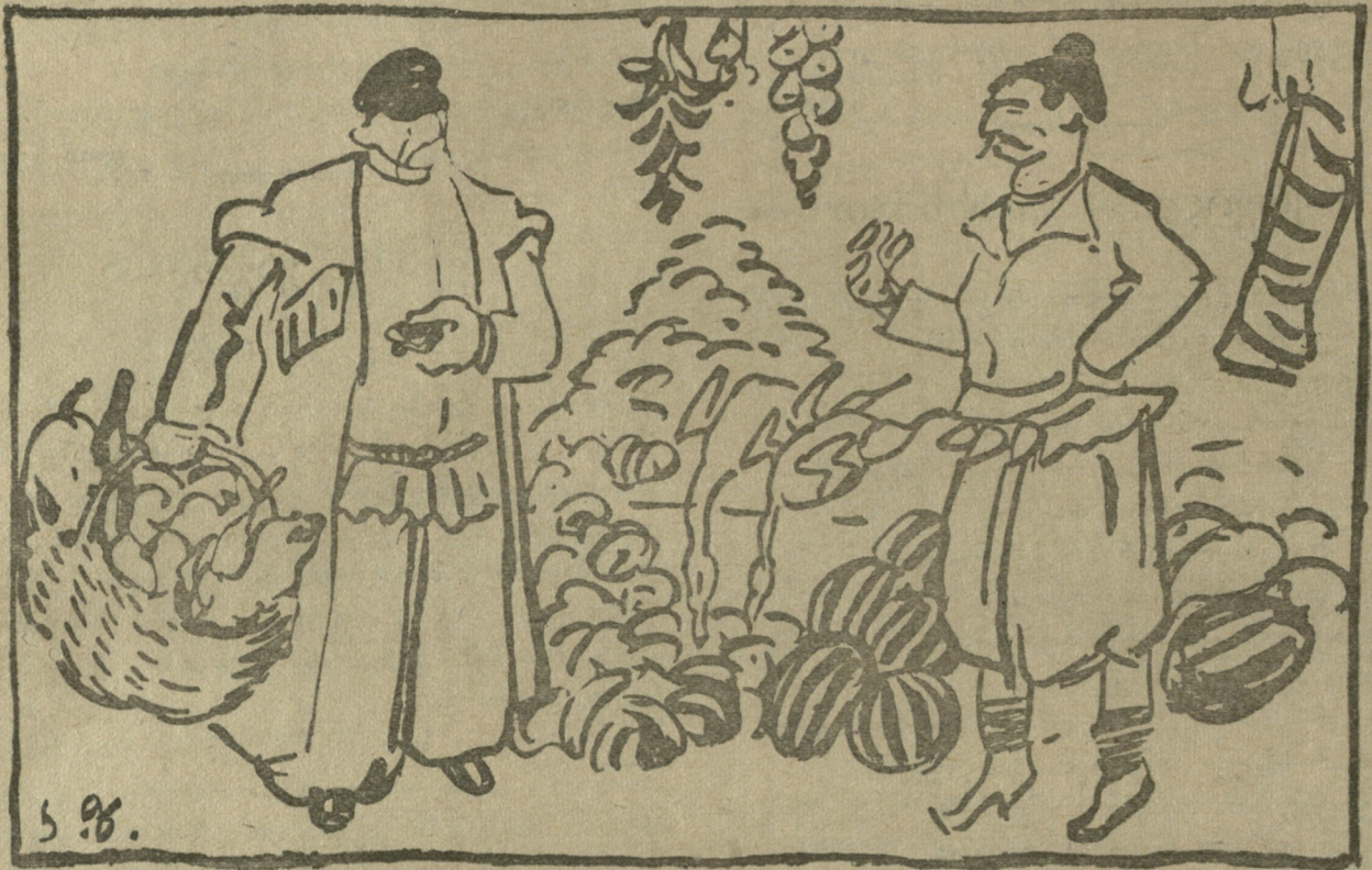
ფული ბაზარში პატარა პორტმონეტი მიჰქონდათ, ხოლო ნაყიდ სანოვავეს დიდ კალათაშიაც ძლივ ატავდენ.