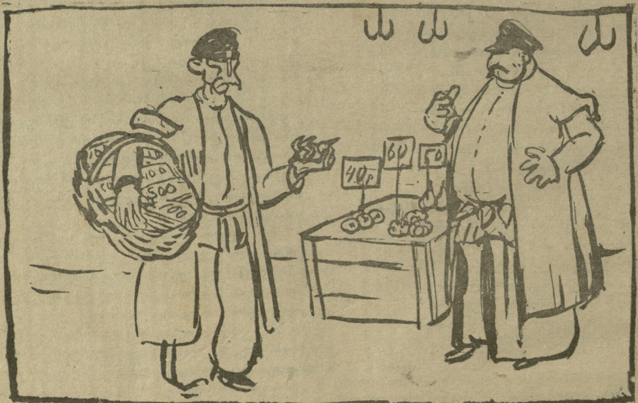
ფული ბაზარში დიდი კალათით მიაქვთ, ხოლო ამ ფულით ნაყიდ სანოვავეს პატარა პორტმონეშიაც თავისუფლად ათავსებენ.