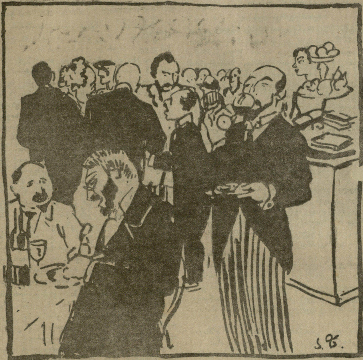
აქ კი, საუზმის მისართმევე ოთახში, ქვორუმი ყოფილა. ასე განაცხადა კრების ერთმა წარჩინებულმა წევრთაგანმა. ცხადია, ქვორუმი პრეზიდენტს და მთავრობაზე უფრო დიდი კაცი ყოფილა.

ფასთა ხელოვნურ—ზრდა-აწევაში დამერწმუნები ტოლი არა ყავთ, ყოველ გვარ ბოროტ-მოქმედბანი, როგორც მათ უჯობთ, იმ რიგათ ვაჰყავთ... მოქალაქე კი ხედავს ამაებს,— მაგრამ შიმშილით რაღა ეთქმება, ფასთა დღიურ ზრდას, შეურაცყოფას, ძალაუნებურ ის ურიგდება. ვიცი, რომ მეტყვი: „რას აკეთებსო ადგილობრივი ამ დროს მთავრობა, (კითხვისთვის მაღლობთ. დმერთმა გიკითხოს და ნუ მოგაკლოს მისი წყალობა!) ქე არის ისე ქეიფის გვართ. ან კი რაღა ქმნას ამაზე მეტი, ნეიტრალიტეტს იცავს ჩარჩებთან, ვერ ვნახვთ მათგან ჩვენ განამეტი.