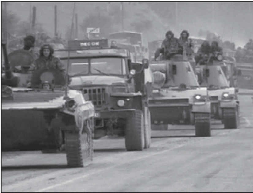
ურდეს და მკაცრი ტონით ელაპარაკოს რუსეთს. მნიშვნელოვანია, რომ საპარტიველო ჰყავს ქლიერი პარტნიორი აშშ-ს სხვით და საპარტიველო მართ არ არის არსებულ სიტუაციაში, - აღნიშნა მან.

დეპუტატის განცხადებით, ამ ეტაპზე ქალიან მნიშვნელოვანია, რომ მსოფლიო თანამშრომლობა გაააქტი-