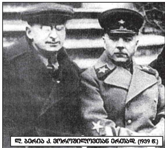
ლ. ბერია კ. ვოროჟილოვთან ერთად. (1939 წ.)