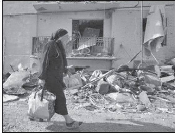
ამოიძრა კვამლი ამ მიწებიდან. ამ თანამედროვე სახეობაზე გაზა უნდა ახდენდეს.