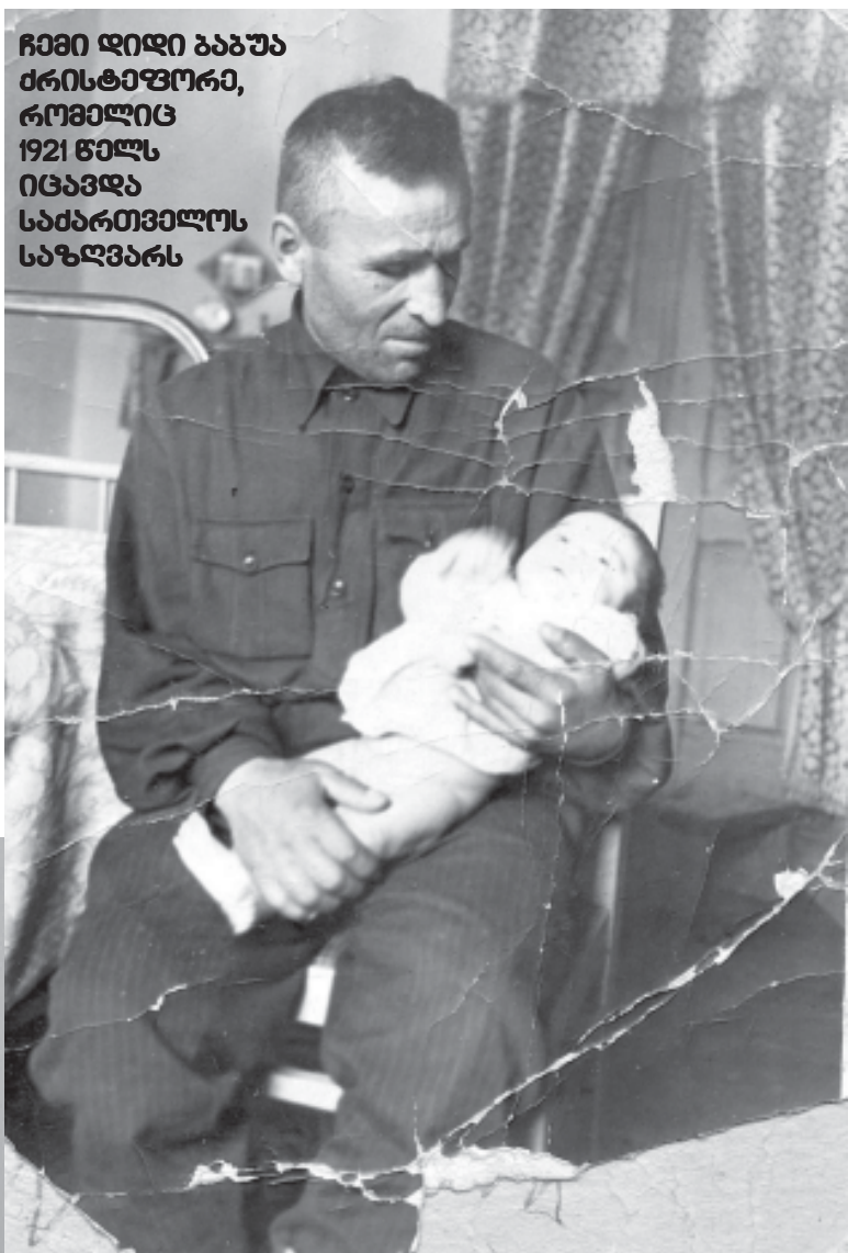
ჩემი დიდი ბაბუა ძრისტაფორა, რომელიც 1921 წელს იცავდა საქართველოს საზღვარს

ჩვენი სამოქალაქო სხეული ნატყვიარია, მაგრამ ქართველი ქართველს ხომ გასაჭირში არ მიატოვებს. ხევი, როგორც თავგადასვლი უმცროსი ძმა, ყო-