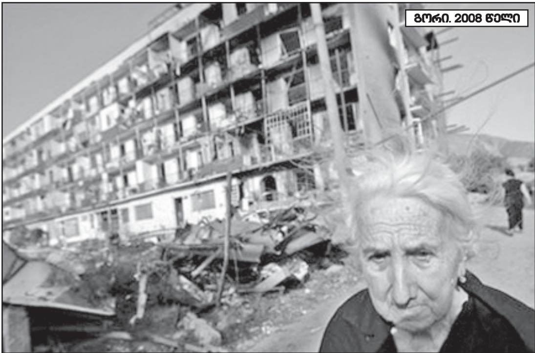
გორი. 2008 წელი

სანამ ცხინვალში შვიდ-დოღით და რუსები საქართველოს ტერიტორიებს დანიკავებდნენ, აფხაზეთისა და სამხრეთ ოსეთის დაბრუნების პერსპექტივა საქმად გარკვეული იყო. ვთქვი და გავიმეორებ, გვირმა აფხაზეთ და ოსმა დანიჯერა, რომ ჩვენ კონფლიქტების მოგვარება მშვიდობიანად გვსურდა. ბოლო ომი რომ არ დაწყებულყო, ალბათ, კიდევ რამდენიმე წელი იყო საქირო და კონფლიქტები მშვიდობიანად მოგვარდებოდა.