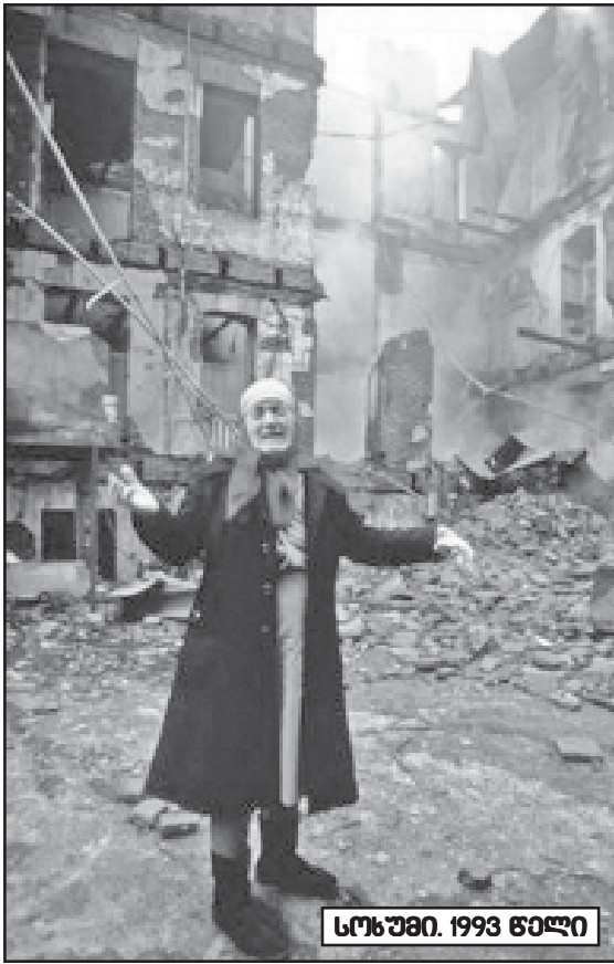
სოხუმი. 1993 წელი