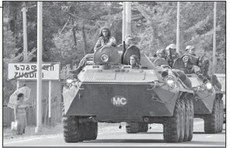
თისა და სამხრეთ ოსეთის ისტორიის იმ კვლავზე, კვლავ „რუსეთის აბრეხილ“ მიიჩნევენ. მაგრამ საქართველოს სხვა ტერიტორიებზე რომ მისგან გამოვლავა ვიძროვან, განა მსაც „რუსეთის

წერილის ავტორები განსაკუთრებით აღნიშნავენ, რომ აქარა კალიან მდიდარია. მისი უმთავრესი სიმდიდრე გათუშის პორტი, რომელიც სსრკ-ს დროს ქვეყნის სავაჭრო და სამხედრო ფლოტის სარეზერვუო ბაზას წარმოადგენდა. მის მიერთებულია ბაქო-სამოქვანილი ნავთობა - და ნავთობპროდუქტსადანი მილი. გათუშის დიდ როლზე ასევე ფაქტიც მითხრობენ: რომლისა 1940 წელს, ფინეთ-