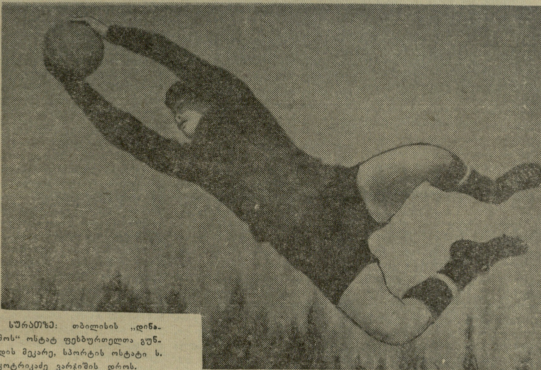
სურათში: თბილისის „დინა- მოს“ ოსტატ ფეხბურთელთა გუნ- დის მეკარე, სპორტის ოსტატი ს. კოტრიკაძე ვარჯიშის დროს.

უკვე გათამაშებულია ხუთი ტური. შეჯიბრებას ლიდრობს ქ. გოგიავა, რომელმაც ყველა პა- რტია მოიგო. მას ერთი ქულათ ჩამორჩება ნაწყებია, 3,5 ქულა აქვს ჩომახიძეს, კახაბრიშვილს აქვს 3 ქულა (ოთხიდან).