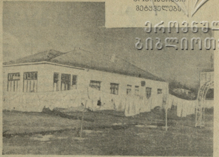
გავშვთა ბაბა სტალიონზე

ამ რამდენიმე წლის წინათ გულ- უთში აშენდა სტალიონი. იგი ერ- თადერთი ბაზა რაიონის სპორტს- მენთა ნორმალური ვარჯიშისათვის. მაგრამ მას მეტად ჭირვეული მე- ზობელი გაუჩნდა ბავშვთა ბაგის სახით. ამ დაწესებულების ხელმ- ძღვანელები არაფრად აგდებენ სპორტსმენთა სურვილს, სულ ხში- რად მოედანნი დაფარულია სარე-