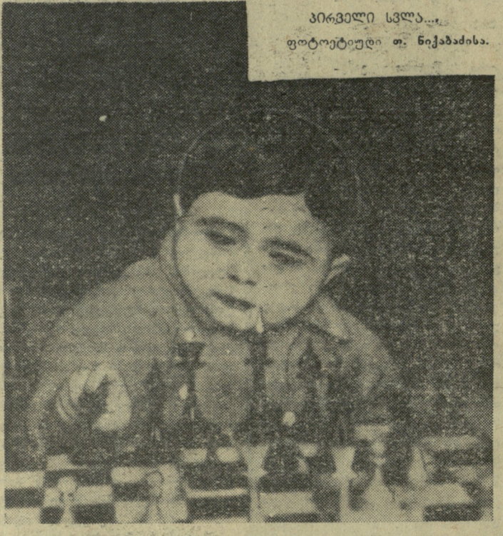
პირველი სვლა...

პორტლანდსა და გოსტონში მომდინარე წლის მძლეობის სიზოონისათვის ქვეყნულ ენს, ლიბიან ანგარიშს მატჩის შემდეგ, ამ დღეებში აშშ-ს მძლეობის მონაწილეობა მიიღეს ერთსა და იმავე დღეს გამართულ ორ შეხვედრაში. პორტლანდში შესანიშნავი შედეგი აჩვენა ახალბედანდელმა მოსტენალმა მ. პელბერგმა, რომელმაც მეორედ გააუმჯობესა მსოფლიო მიღწევა 2 მილზე რბენაში. მისი შედეგია 8. 34,3 წამი — 2,3 წამით ჩამორჩება მსოფლიო რეკორდს ლია სტალონისათვის. აღსანიშნავია, რომ მან უფრო ადრე სტენფორდის დარბაზში ამავე დისტანციას აჩვენა 8.40,4 წ. ბირმინგემის კვარტში ორი ძირითადი კონკურენტის პ. ობრაინისა და ლ. ლონგის ორთაბრძოლა პირველ გამარჯვებით დამთავრდა — 18 მ 89 სმ. ლონგმა მასთან 83 სმ-ით წააგო. წარუმატებლად გამოვიდა ოლა. პიური ჩემპიონი ო. დევისი 500 იარღზე რბენაში. მან წააგო მანამდე ნაკლებად ცნობილი რ. პარგერთან (აჩვენა 59,5 წ.) და მეორე ადგილი დაიკავა. 1000 იარღი მოიგო კანადელმა ს. ოლემენმა — 2.11,4. ბოსტონში კარგა შედეგი აჩვენა რომის ოლიმპიურ თამაშებზე მეთხუთსედი ადგილის მფლობელმა პონტო-რიკიელმა რ. კრუსმა, რომელმაც ჭოკით დაძლია 4 მ 42 სმ 1000 იარღზე აქ უკეთესი შედეგი იქნა ნაჩვენები, ვიდრე პორტლანდში. ე. კანლიფმა ამ მანძილს გარბენას მოახლოდა 2.10,2 წამი.