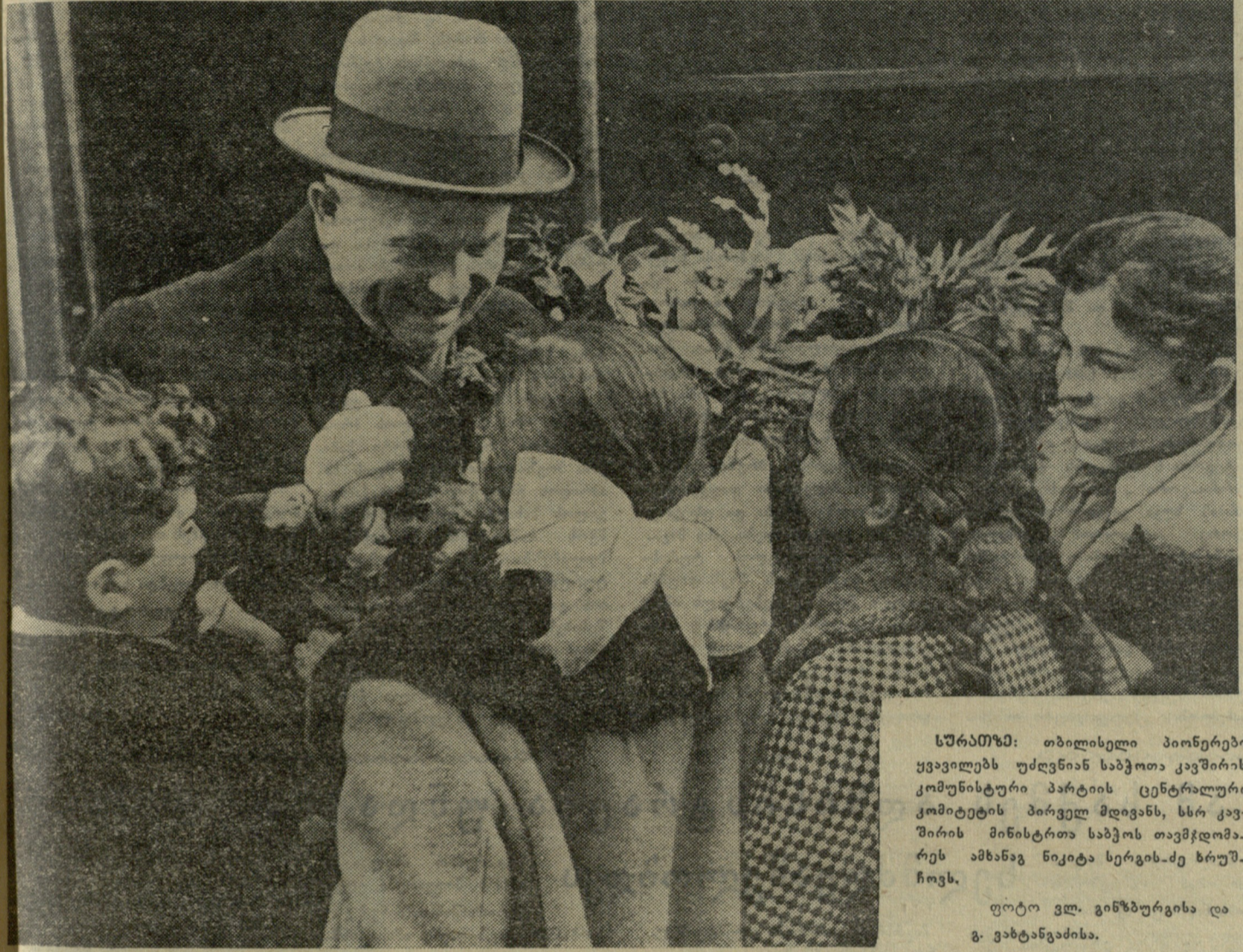
სურათში: თბილისელი პიონერები ყვავილებს უძღვიან საბჭოთა კავშირის კომუნისტური პარტიის ცენტრალური კომიტეტის პირველ მდივანს, სსრ კავშირის მინისტრთა საბჭოს თავმჯდომარეს ამხანაგ ნიკიტა სერგისძე ხრუშჩოვს.

დაიწყო სსრ კავშირის 28-ე საპარტოლო ჩემპიონატის ფინალური XV ტურში. შეტანილნი არიან ირანის დელეგაციის წევრები. მსოფლიო უოფლიო ჩემპიონი უძღური აღმოჩნდა ოდესელი გროსმაისტერის იერიშის წინაშე და დამარცხდა. ამ ტურში სხვა დელეგაციებიც მდიდრად ითამაშეს. პეტროსიანმა მოუგო ხასინს, სპასკიმ საიმედოდ გადადო პარტია სიმაგინთან და მხოლოდ პოლუგავესკი იძულებული იყო ყაიმს შერიგებოდა ტარასოვთან. ტაიმახოვმა მოუგო თავის მწვრთნელს ბორისენკოს. XV ტურში გაგრძელდა დელეგაციის შიდა ბრძოლა. მასინ, როცა პეტროსიანი და სპასკი ყაიმით დაკმაყოფილდნენ, გელერი და პოლუგავესკი წაგების პირას იდგნენ. ჩერეკოვი ისეთი შეუპოვრობით უტემა გელერს, რომ მისი გამარჯვება ეჭვს არ იწვევდა. მაგრამ, როგორც ყოველთვის, ცაიტროტში ჩერეკოვმა სუსტად ითამაშა და ბოლო გადადებულ პარტიაში თვითონ უნდა ეძებოს ყაიმი. შესანიშნავად ითამაშა სიმაგინმა, რომელმაც დაამარცხა პოლუგავესკი. ბევრი ეცადა სმისლოვი ფურმანთან პარტიაში, მაგრამ ვერაფერს გახდა. ლენინგრადელი ზუსტად თამაშობდა და სმისლოვმა 42-ე სვლაზე თვითონ შესთავაზა მოწინააღმდეგეს ყაიმი. ლუტიკოვმა დაამარცხა ხასინი, ტაიმახოვმა-ტარასოვი. დანარჩენი პარტიები გადაიდო. კორჩნოის ავერბახთან ორი წუდმეტი პაიკი გააჩნია, მაგრამ მოგება საეჭვოა. ბროსტინის შეუძლია მოუგოს ხასინს, ხოლო შტიინმა—გუფელსს, ბორისენკო საყაიმო შანსებს ინარჩუნებს ბოლესლავსკისთან. XV ტურის შემდეგ ტ. პეტროსიანს აქვს 10,5 ქულა, ე. გელერს—9,5 ქულა და ერთი გადადებული პარტია.