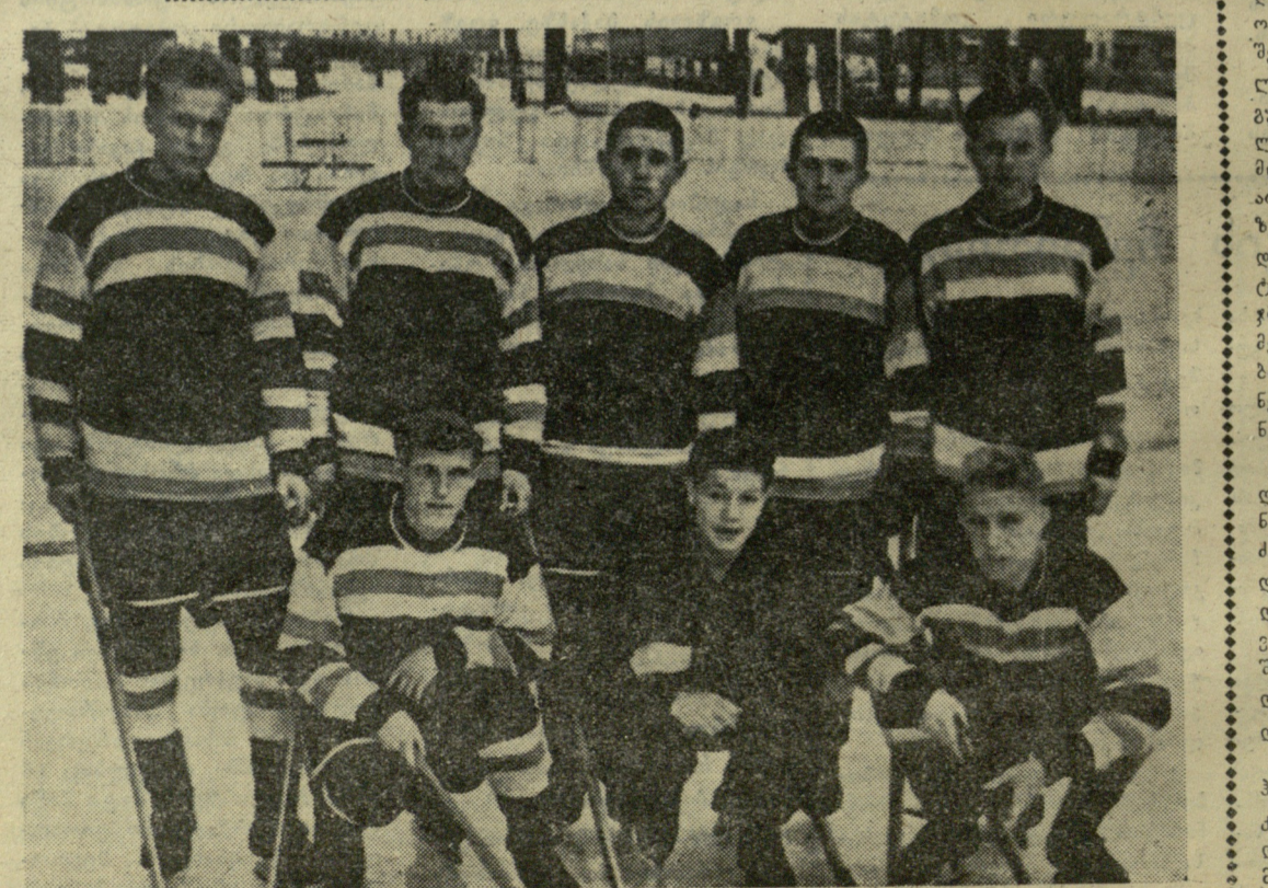
ახალქალაქის გუნდი — საქართველოს 1961 წლის ჩემპიონი შიბიან ჰოკეიში.

საქართველოს ჰოკეისტთა ორი მატჩი 29 იანვარს, ტალინში საქართველოს ახალბედა ჰოკეისტთა გუნდმა გამართა თავისი პირველი ოფიციალური მატჩი საქვეშიორ შეჯიბრებაზე, რომელშიც მონაწილეობენ რესპუბლიკის ნაკრები გუნდები. როგორც მოსალოდნელი იყო, ჩვენმა ჰოკეისტებმა, რომლებმაც ფაქტიურად ორი თვე არ არის, რაც ნამდვილ ყინულზე დაიწყეს ვარჯიში, განიცადეს დამარცხება დიდი ანგარიშით ესტონეთის ნაკრებთან — 0:25. შეჯიბრების დებულების თანახმად მეორე დღეს გუნდები განმეორებენ მატჩში შეხვდნენ ერთმანეთს. გაიმარჯვეს კვლავ ესტონელებმა — 12:0. ეს დამარცხებები არ უნდა გადასდეს იმედგაცრუების საბაბი. მანამ, სანამ ჩვენი გუნდი შექმნის სატურნირო გამოცდილებას და რამდენადმე სრულყოფილად დაეუფლება ჰოკეის თამაშის მრავალფეროვან ტექნიკურ არსენალს შეუძლებელია მან არ განიცადოს დამარცხებები, თუნდაც ასეთი დიდი ანგარიშითაც კი. შემდეგი მატჩი საქართველო ჰოკეისტებს ჰქონდათ ლიტვის ნაკრებთან, მაგრამ არ შედგა. ვინაიდან ლიტველებმა გათამაშებულ მონაწილეობაზე უარი განაცხადეს.