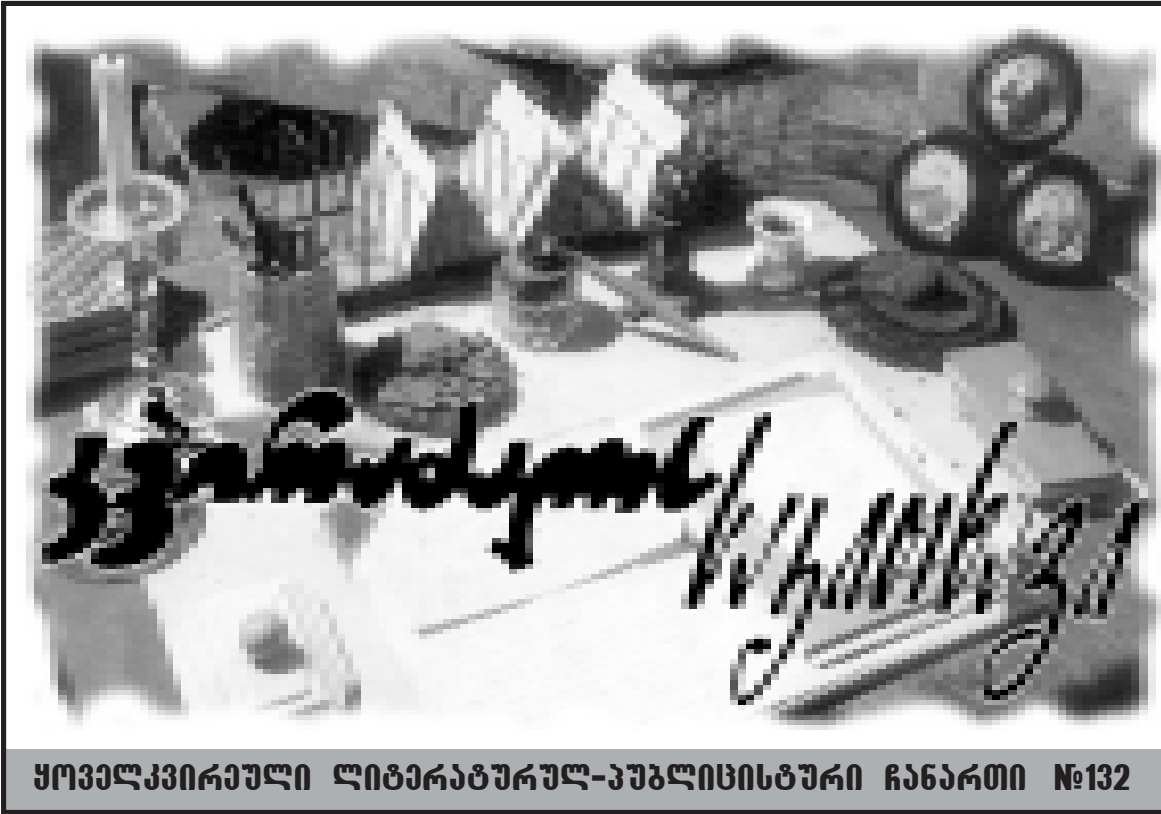
ყოველკვირეული ლიტერატურულ-კულტურული ჩანართი №132