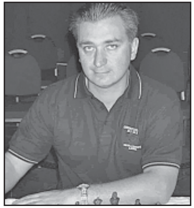
— დიას, ჩვენს მოქალაქეებს... დიას, ჩვენს მოქალაქეებს...