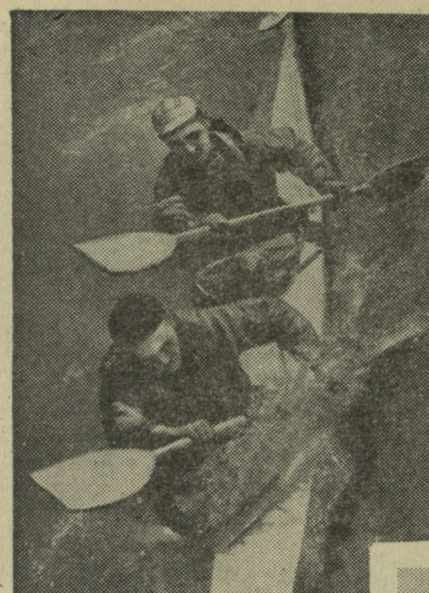
ბათუმში დამთავრდა ნიჩბოსანთა შეჯიბრება (საიუბილეო სპარტაკიადა).

ბათუმში, „სპარტაკის“ ჩოგბურთის ზღვისპირა კორტებზე პირველი ჯგუფის ხუთი კოლექტივი ჩაება საიუბილეო სპარტაკიადის პროგრამით გათვალისწინებულ შეჯიბრებაში. თვითველ გუნდში გამოდიოდა 2 ვაგონი და ამდენივე ქალი. ტურნირი მაღალ დონეზე ჩატარა თბილისის ორთქლმავალ-