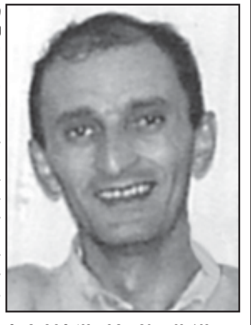
გვინატრები, ძალიან გვინატრები, ჩვენი ძვირფასო კობა...