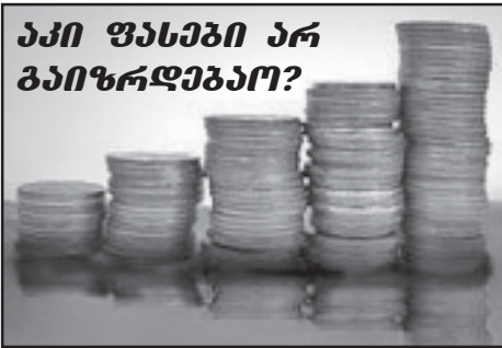
აკი ფასები არ გაიზარდება? ლი და ახლა, როცა ეროვნულმა ვალუტამ იმავი ხელისუფლების მხარულით დევალვაციის მოკვები ამოყო თავი, მოგვებს იმავად როგორღა იმავოდ? მოხდა ის, რაც უნდა მოხდარიყო – სიცოცხლად იცოდა უმეტეს მფლობელებში, ერთნი რომ კარგად, მეორენი ვალუტაზე გასაყვირდა იმავად, თუ ამავრავლად იმავად, ვინც ლარის კურსის კატასტროფული ვარდნა განიცადა და ამის მოსალოდნელი შედეგები წინასწარ განისაზღვრა, ახლა მილიონებს გამოკრის ხელი?

ხალხი, რომელიც იტყვიან, ელაგობა მცა, ალარ იცოდნა რა ეძნა – ვალუტა, რომელიც ომით შიშინებულმა განკვირდნა გამოიტანა, უპირატესობა ეძიებდა და ეძიებდა თუ განკვირდნა ეძიებდა, მოკვლევს ალბათ სხვის სხსრავოდ უნდა გაეშთმეგრინა თუ ხელსაყრელ მომენტს დალოდებოდა? არც ერთის გარანტიას იძლეოდა ვინმე, არც მეორისას და არც უამრავი სხვა მსგავსი შემთხვევისას. მხოლოდ ნაგავსა და ზარალი – აი, ერთადერთი გარანტიას, რაც ხელი-სუფლებამ ვალუტის კურსის უცაბედი ნახტომით საკუთარ ხალხს ხელში შეატოვა.