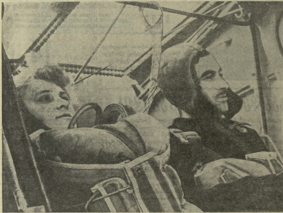
სრულიად სხვადასხვა ასაკისა და პროფესიის ადამიანებს ნახვით საქართველოს დოსაფის