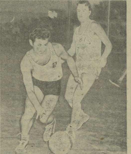
აღნიშნული კოლექტივების განმეორებით შეხვედრაში უპირატესობა ჩეხების მხარეს იყო, რომლებმაც მოიგეს კიდევ მატჩი — 66:48. სურათზე: საქართველოს პოლიტექნიკური ინსტიტუტისა და „სლოვან ორბისის“ კალათბურთელთა გუნდების შეხვედრის მომენტი.