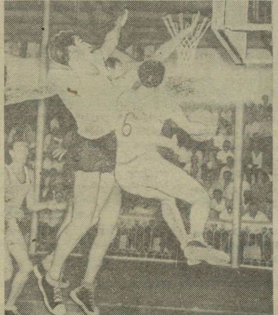
ჩეხოსლოვაკიის კალათბურთელთა გუნდი „სლოვან ორბისი“ თბილისიდან გაემგზავრა ფოთში და იქ ორი ამხანაგური შეხვედრა გამართა. პირველ დღეს ჩები კალათბურთელების წინააღმდეგ თამაშობდა საქართველოს პოლიტექნიკური ინსტიტუტის გუნდი. შეხვედრა მოიგეს თბილისელმა სპორტსმენებმა — 57:50.

კოლექტივმა წააგო ტარტუს უსკასთან — 53:58. საქართველოს პოლიტექნიკური ინსტიტუტის კალათბურთელები შეხვედრენ მოსკოვის „დინამოს“, მატჩი აღინიშნა ქართველ სპორტსმენტთა უპირატესობით და დამთავრდა მათივე გამარჯვებით — 60:54.