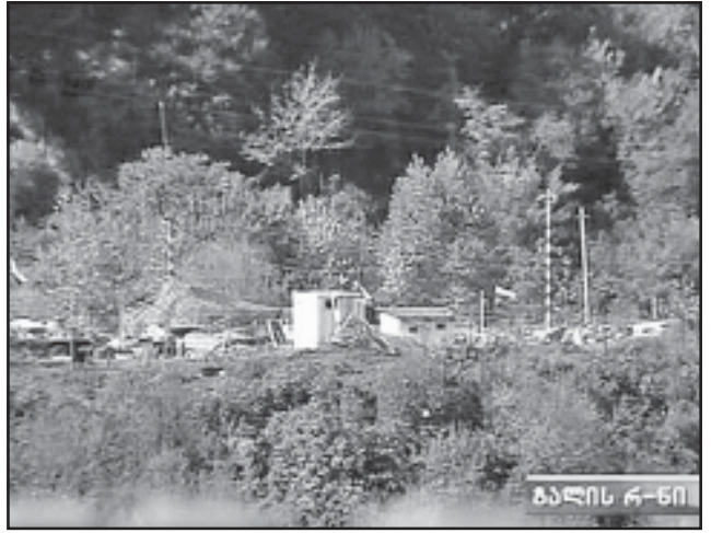
გაგის რაიონის მოსახლეობის ინფორმაციით, რუსი სამხედროები ტყის მასივის 2-კილომეტრიანი ზოლის გასუფთავებას გეგმავენ.

ოქუანტაბი სოფელ ფიჩორისა და განეშურის ადმინისტრაციულ საზღვართან, ტყის მასივში განლაგდნენ.