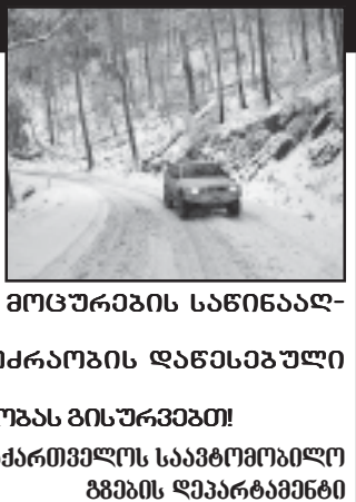
საქართველოს საავტომობილო გზების დეპარტამენტი