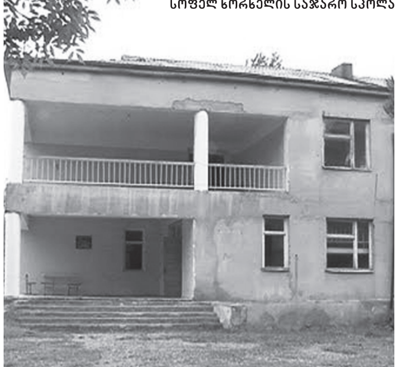
სოფელ ხორხელის საჯარო სკოლა

ყველა ფერისა და ერის ადამიანი ღვთის შვილია – გავუფრთხილდეთ ერთმანეთს! საშინელმა ომებმა, განსაკუთრებით, პირველმა და მეორე მსოფლიო ომებმა, კაცობრიობას სრულად დაანახვა ომების საშინელება. მთელს მსოფლიოში დღეს უპირველეს ადგილზე „ადამიანის უფლებები და თავისუფლებები“ დგას. ჯერ კიდევ 1945 წელს შექმნილმა გაერთიანებული ერების ორგანიზაციამ მიზნად დაისახა მსოფლიოში მშვიდობისა და საერთაშორისო წესრიგის დაცვა და უპირველეს საკითხად სწორედ ადამიანის უფლებები და თავისუფლებები დააყენა. პირველი და მეორე თაობის უფლებათა უზრუნველსაყოფად აუცილებელი გახდა ადამიანის უფლებების ახალი კატეგორიების აღიარება. მესამე თაობის უფლებებს მიეკუთვნება მყარი