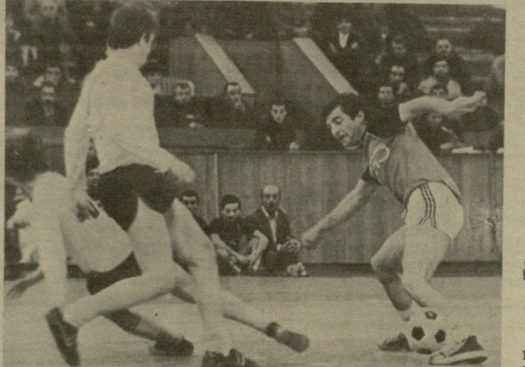
მომენტი შეხვედრიდან: „ვერა“ — „დაუგავა“.

უგავა“ — 7:0, „ვაკემ“ სძლია „არარატი“ — 2:0, „ვერა“ — „ბაკინეცის“ შეხვედრა დასრულდა ფრედ — 1:1.