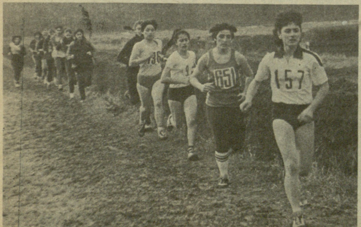
გოგონები 3000 მეტრზე რბენის დროს.