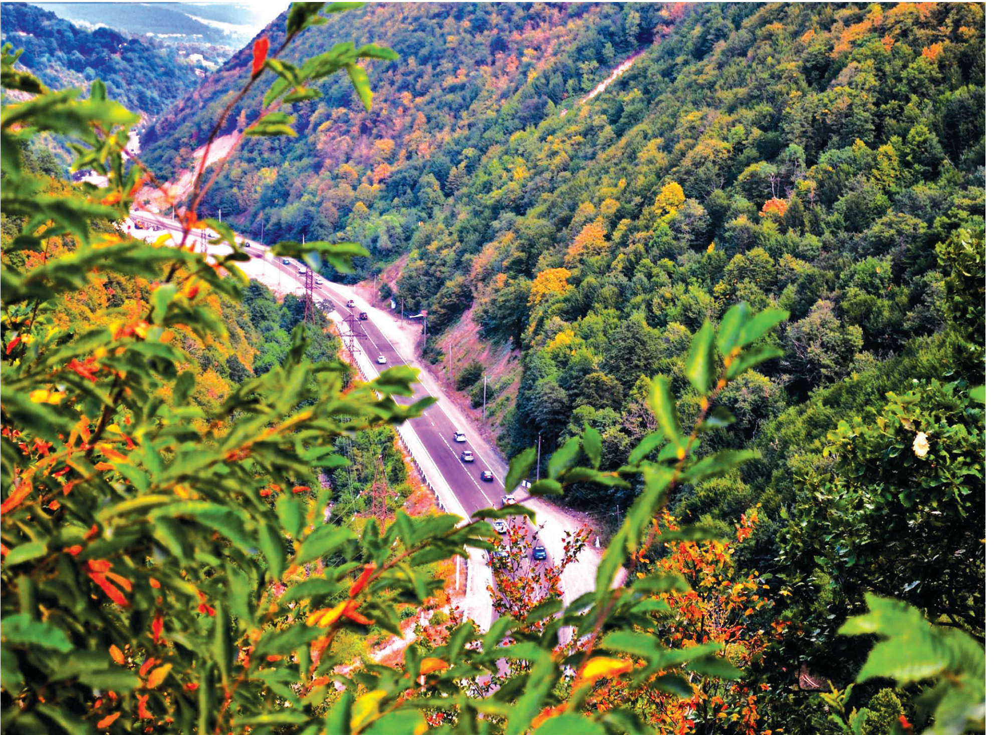
ჩვენი მუნიციპალიტეტის დასავლეთის „ჭიშკარი“.