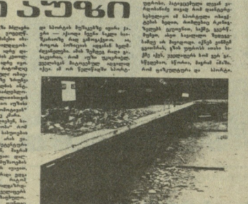
ფორსი, სავალდებულოდ მუშაობს ახლა, როდესაც ჩვენი ქვეყანის კაბიტალური რემონტის პროგრამა დაიწყო.

საკბ XXVII სარტობაში ითქვამს: „ჩვენი პარტიის მიზანია, რა ჩვენი პარტიის მიზანია...“