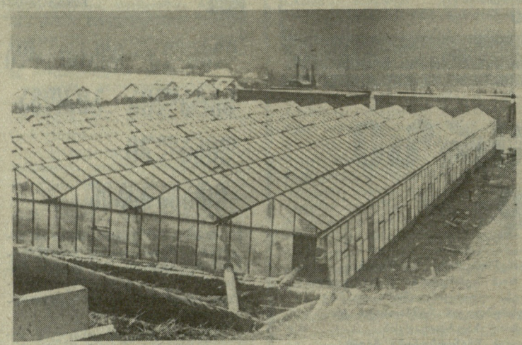
სტადიონისთვის პირველად გამოყოფილ ადგილზე ამჟამად სათბურებია.

საქმე ახლაც დიდრა, დამუშავ- და პროექტები სპორტული კომ- პლექსისათვის. კომპლექსი კი ფეხ- ბურთის მინდვრის გარდა კალათ- ბურთის და ხელბურთის მოედნ- ბის მოწყობასაც ითვალისწინებს. მაგრამ მშენებლობის დაწყება რა- ტომდაც კიანურდება. ახალბაში კვლავ გამოჩნდნენ ახალი მოძა- ლადეები — სპორტული კომპლექ- სისათვის გამოყოფილ მიწის ნა- კვეთზე მშენებლობა დაიწყო... ახ- ლად ჩამოყალიბებულმა მცხეთის სამეურნეობათაშორისო სამშენე- ბლო ორგანიზაციამ. რის საფუძ- ველზე? შემოხსენებულ ორგანი- ზაციას ხელთ აქვს მცხეთის საქა- ლაქო საბჭოს აღმასკომის გადა- წყვეტილება, რომელიც მიღებუ- ლია 1985 წლის 25 ივნისს. არ გა- გვიკვირდეთ და... ამ გადაწყვეტი- ლებაში ის ტერიტორია, რომელიც იგივე საქალაქო საბჭომ 6 თვის წინათ სპორტკომპლექსის მოსაწყ- იობად დამტკიცა, ახლა სამეურ- ნეობათაშორისო სამშენებლო ორ- განიზაციას აღმინისტრაციული შე- ნობის ასახვად და საქმიანი ელს მოსაწყობად გამოუყო. (საზღვრე- ბიც და ფართობიც იგივეა მითი- თებულში), განსხვავება მხოლოდ