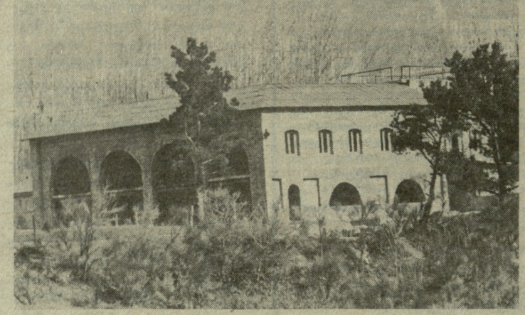
ეს ის ადგილია, სადაც სპორტული კომპლექსი უნდა აშენებულიყო.