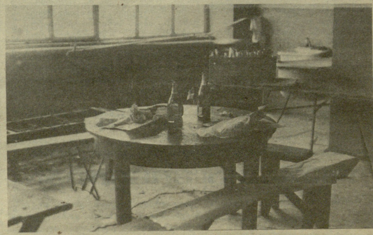
სურათებზე: ზევით — I კვარტალის X კორპუსი, ქვევით — დღეს ახე გამოიყურება ამ კორპუსის საბანკეტო დარბაზი მე-17 სართულზე.

რამდამცინიბანან: როგორც ხედავთ, ერთსა და იმავე საკითხზე ერთი კორპუსის მცხოვრებლები დაამტკიცებულად საწინააღმდეგო აზრი აქვთ. ჩვენი მხრიდან დავძენდით, რომ მე-17 სართლის ფართობი მაინც შეიძლება მოხსნალონ სამსახურელო გამოვიყენოთ. ისე, რომ არც მე-16 სართულზე მცხოვრებ ოჯახებს დაერღვათ მუშაობა. მაგალითად, ამავე კორპუსში ბევრი ტურიზმის მოყვარული ცხოვრობს, რომლებსაც საკუთარი კარები, ზურგჩანთები და