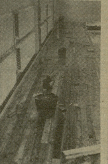
ქერიდან ჩამონგრეული ბათქაში.