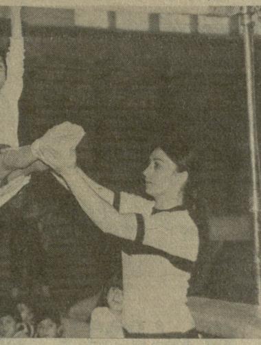
უკან დარჩა რამდენიმე მეცადინეობა. წყნეთის ბავშვთა სახლის აღსაზრდელები ახლა უფრო თამაშად უფრო ლაღად ასრულებენ ტანვარჯიშულ და აკრობატულ იდიუმებს, ნორჩებს დიდ სიხარულს გვრის ყოველი მეცადინეობა, რაც მათ გ. ეგნატაშვილის სახელობის თბილისის ტანვარჯიშულ სპორტულ სკოლაში უტარდებათ. ისინი აქ, როგორც ადრე ვიწუყებოდით, წყნეთიდან საგანგებოდ ჩამოყავთ სამეცადინოდ სპეციალური ავტობუსით.