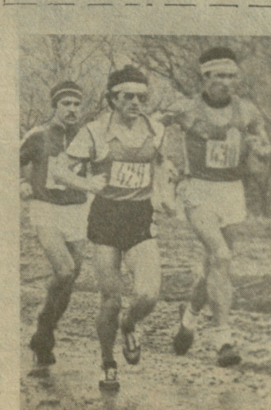
სურათზე: საქართველოს სპორტსახეობის ნაკრები გუნდები (ფიზკულტურის ინსტიტუტი ცალკე გუნდს გამოიყვანს), „დინამოს“ პროფკავშირულ სპორტსახეობებთან სპორტსმენები, არმიული მობრები, მოწვეულნი არიან: ანდრეაჩანისა და სომხეთის გუნდებიც. შეჯიბრება მცხეთის ტყე-პარკში 14 საათზე დაიწყება.

ფრეთა ლიბიტი წლებულსაც ძალაში დარჩა: უმაღლეს ლიგაში 10 ფრეთ, I ლიგაში — 12.