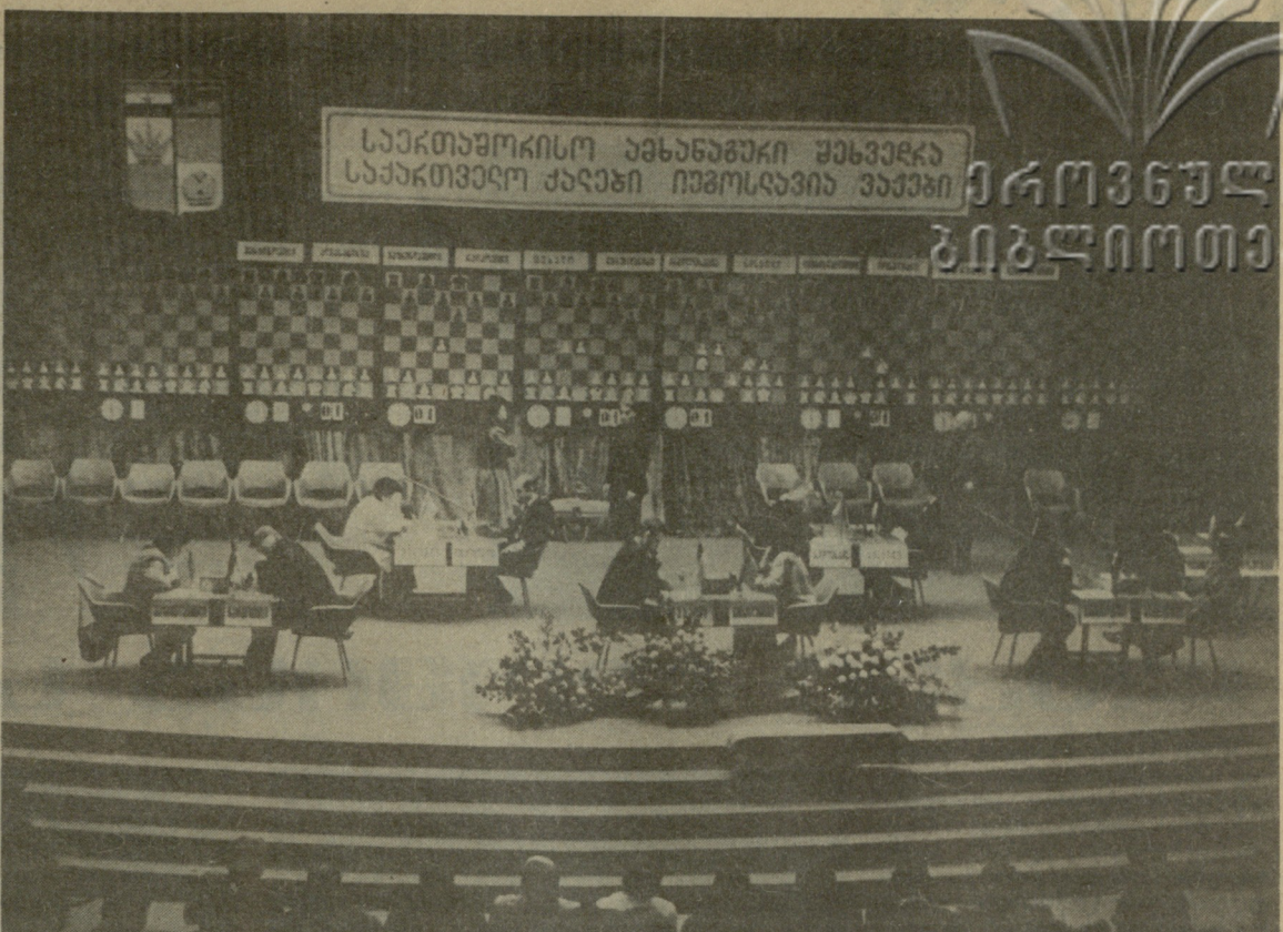
თბილისის ჭადრაკის სახელმწიფო საერთაშორისო ამხანაგური შეხვედრა ქალაქში საქართველოს (ქალთა) და იუგოსლავიის (ვაჟთა) გუნდებს შორის.

თბილისის „დინამოს“ და ლენინგრადის „ზენიტის“ გუნდის წევრები მატჩის დროს.