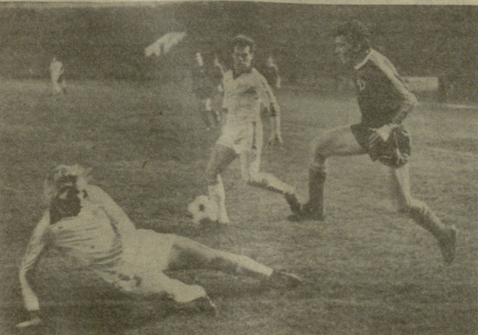
თბილისის „დინამოს“ და ლენინგრადის „ზენიტის“ გუნდის წევრები მატჩის დროს. იხ. მე-3 გვ.

თბილისის „დინამოს“ და ლენინგრადის „ზენიტის“ გუნდის წევრები მატჩის დროს.