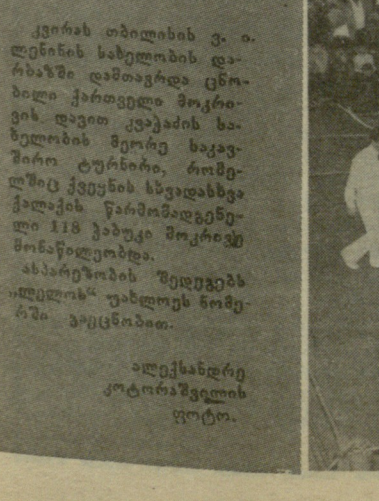
კვირას თბილისის ვ. ა. ლენინის სახელობის დარბაზში დამთავრდა ცნობილი ქართველი მოკრივის დავით კვაჭაიძის სახელობის მეორე საკავშირო ტურნირი, რომელშიც ქვეყნის სხვადასხვა ქალაქის წარმომადგენელი 118 კაბუჯი მოკრივე მონაწილეობდა.

(ამ შეჯიბრებას ჩვენი გაზეთი კვლავ დაუბრუნდება).