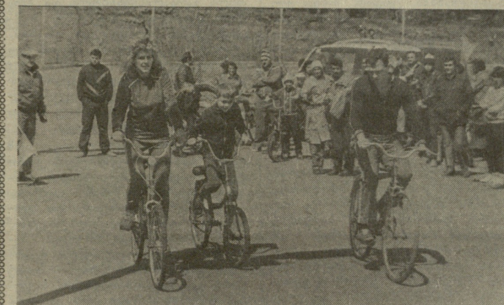
სპორტული ბაზების შესაძლებლობების გამოყენებისათვის

როგორ ვეყენებთ სპორტული ბაზების შესაძლებლობებს მოსახლეობას შორის გამაქანსაღებელი მუშაობის გაქტიურებისათვის? ამ კითხვაზე კონკრეტული საქმით ვახუბა თბილისის ცენტრალური ველოდრომის გამაქანსაღებელმა ცენტრმა. ვახულ კვირას აქ მოეწყო „ლია კარის დღე“ — ველოსპორტის მოყვარულებს უსახყიდლოდ დაუთმეს ინვენტარი, ზოგმა იხიერა, ზოგმა კი შეჯიბრებაშიც მიიღო მონაწილეობა. ცალკე დონისძიებები მოეწყო ოჯახებისთვის.