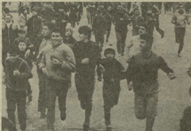
ქუთაისი: კროსი ქალაქის ქუჩებში.