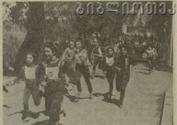
რუსთავი. ერთ-ერთი შეჯიბრების დროს.