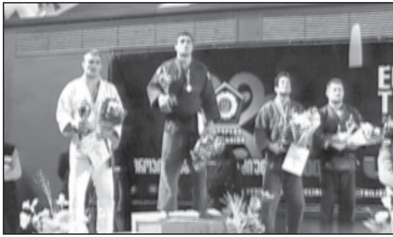
ანი ითვლება. მანაც უპრობლე- მოდ გაიკვალა გზა ფინალისკენ, იმ...