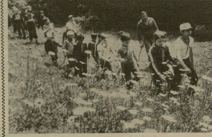
პიონერული ზაფხულის სიხლსახე ცხოვრებას დაუსღაგურება ცხვარიკამაში, საღაც ათასობით მოწარდი ისევენებს. რეპორტაჟს პიონერული ჭაღაქიდან „ლეღოს“ უახლოეს ნომერში შე-მოგთავაყუნთ.