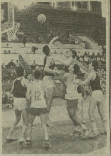
სურათზე: ბოლო შეხვედრის მომენტი; ქართველმა და ამერიკელმა კალათბურთელებმა სამახსოვრო სურათი გადაიღეს.

ლი შენგელია მთელი ძალით ვებლარ თამაშობდა. ამიტომ თბილისელებმა თავიანთი კოზირი — პოზიციური თავდასხმა ვერ გამოიყენეს.