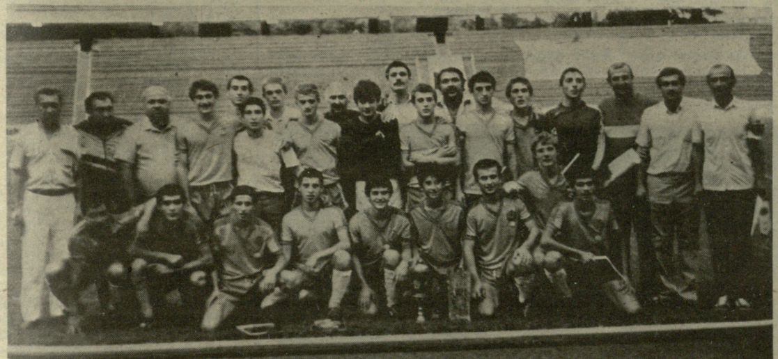
სპორტსკოლების მოსწავლეთა საკავშირო თამაშების საფეხბურთო ტურნირის ჩემპიონი საქართველოს ნაკრები.