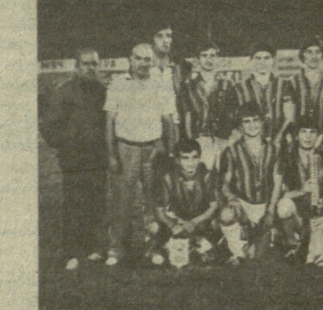
მესამე პრიზორი — „იპედი“.

26 აგვისტოს თათბირი. შ. სუხარვეცი, მოსკოვის ოლქის „ორლიონოსის“ მწვრთნელი: „როგორც ვატყობ, ბოლო სიტუვა მე შეეუყვნის. მართალია ჩვენ მეხუთე-მეექვსე ადგილებისთვის მატჩი მოუ-