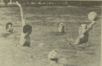
შაბათს და კვირას გაიმართა უმაღლესი ლიგის წყალბურთულთა საკავშირო ჩემპიონატის მორიგი ტურის მატჩები.