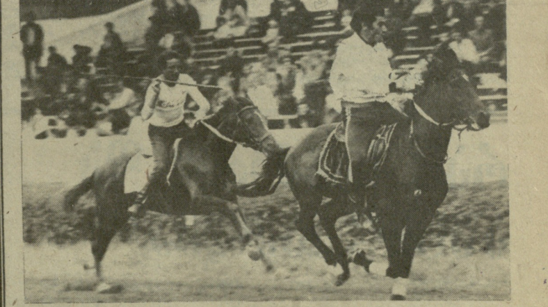
თბილისის იზორომზე გრძელდება ცხენოსანთა საკავშირო შეჯიბრება. სადაც ფართოდ წარმოდგენილი ეროვნული სახეობები. სურათზე თქვენ ხედავთ ისინი შეჯიბრების მომენტს..