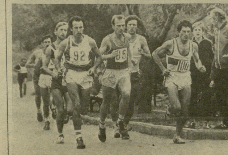
სურათზე: ლიდერთა ჯგუფი დისტანციაზე.

© როგორი იქნება გაზეთი ახალ წელს? — უურადლების ცენტრში იქნება საბჭოური ცხოვრების წესის პრო-