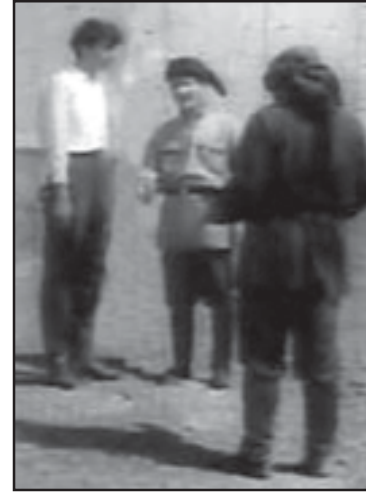
ცენტრშია – „სი-ინ-ენი“ თუ „პი-ბი-სი“ თავიანთ გადაცემებს საპარტიოლოში მიმდინარე მოვლენების გაშუქებით იწყებენო.

...ჩვენი მაღალჩინოსნები ხშირად ტრავახსოვდნენ (ასე იყო, მაგალიტად, „პარლამენტის რევიუ“ უცინი) თუ 2007 წლის ნოემბრის პაციენტის დროს და ახლაც იკვანინა – საპარტიო მთელი მსოფლიოს მხარდადების