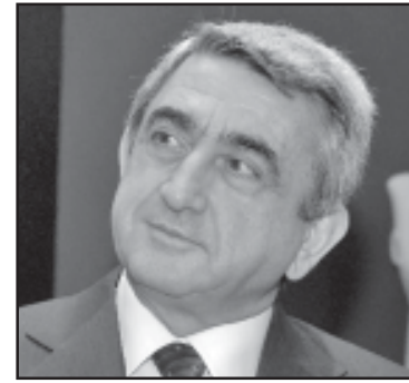
ვალეს – სულაც ყალბი დოკუმენტები ჰქონდათო; საპარტიოლოსთან სავიზო რეჟიმის შემოღების საჭიროებაზეც ალაპარაკდნენ...

თუ აქამდე უკანინა ჩვენი ერთ-ერთი ყველაზე ახლო მეგობარი იყო, ჩვენს ძველხან შორის ურთიერთობაში უკვი საკანოდ გაცივდა – ახლანა ჩვენი სტუდენტები აყვავებენ უკანინა-ყოლონეთის საზღვარზე, მანამდე ჩვენი მოცეკვავეებიც გაან-