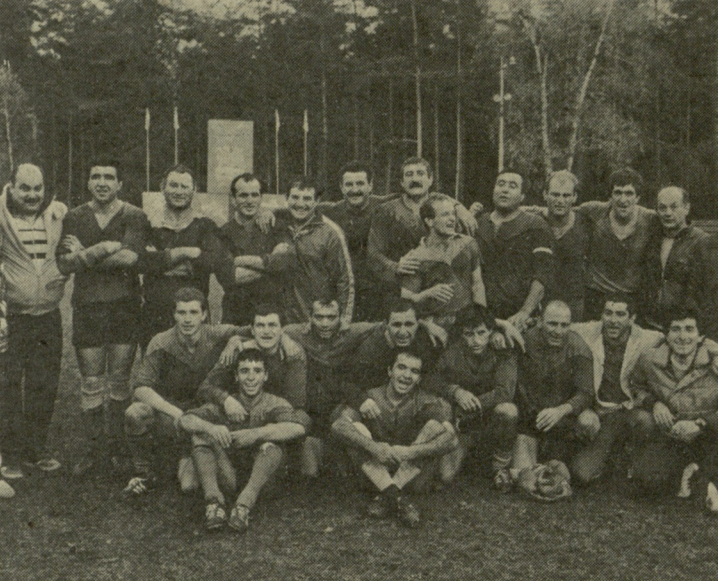
მუთისის რეპუბლიკის გუნდი „მინეველი“.