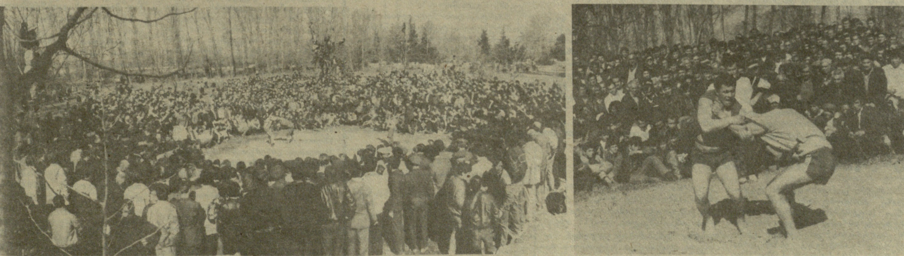
როცა ზამთრის სუბსის შემდეგ მზე გამოიხედავს, მიწაც ცოტა გაშრება და კაცს ღია ცის ქვეშ დგომა აღარ უჭირს. ლელიანელებიც არ დალატობენ ტრადიციას და თაღარგს იჭერენ, რომ სრულ მზადყოფნაში იყოს სოფლის საკილაო წრე, სადაც ხშირად, გაზაფხულიდან შემოდგომამდე ხმაურის დროს, და ფალავანები ერთმანეთს მალას უხიზნავენ — იმართება ქართული პილაობის საღამოები. მოასპარეზებს იწვევენ მეზობელი სოფლებიდან, რაიონებიდან. წელევანდელი სპორტული სეზონის დასრულების რაიონის ამ სოფელში ტრადიციულად ქართული ჭრუდენ გაბრიძის ტექსტი და ფოტო