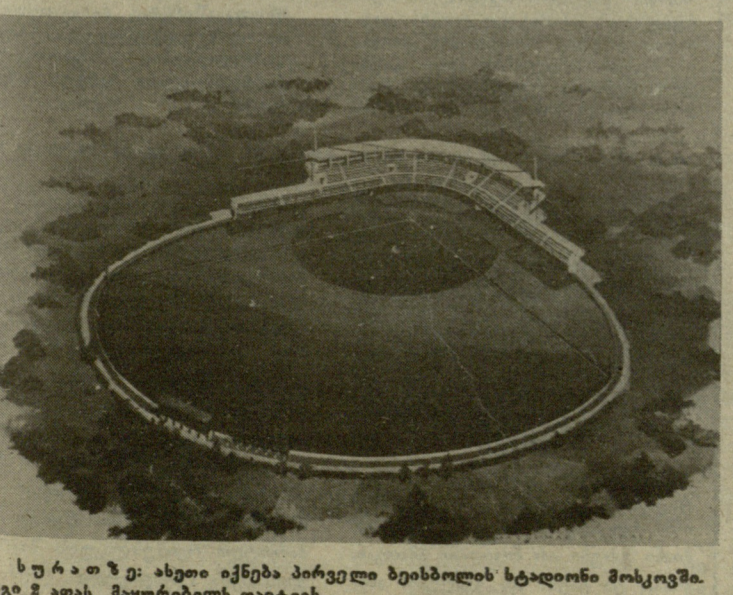
სურათზე: ასეთი იქნება პირველი ბეისბოლის სტადიონი მოსკოვში. იგი 2 თაის მუშურებელს დაიტევს.

ლანდიელი იან ტიმანი ბელგიაში — უზგრელ ლიოპ პორტიმს. ინგლისელები ნიჯელ შორტი და ჯონათან სპილმენი ერთმანეთს შეხვედებიან ლონდონში ამა წლის აგვისტოს მეორე ნახევარში.