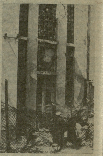
დარბაზის გარეთა ხელი.

დღეს ეს სპორტული ბაზა (თუ კი ამას ახლა სპორტული ბაზა ეთქმის) საფლავო მდგომარეობაშია. აქ ზუსტად ორი წლის წინათ დაიწყო რეკონსტრუქცია-შეკეთება. იქაურთა მიანგრ-მოანგრის, გამოტყის გათბობა, წყალი, ჩამოსხვის ფანჯრები, ამოტყის კედლები... თქვეს, რომ ყველაფერს განახლებდნენ, ალადვენდნენ, მაგრამ... განახლებას ვინა ჩივის (ძველი მაინც არ დაეწვიათ), უკვე ერთი წელია თითი თითზე არ დაუკარებიათ, უმისამართოდ გაქრნენ ეგრეთ წოდებული „რესტავრატორ-შემკეთებლები“.