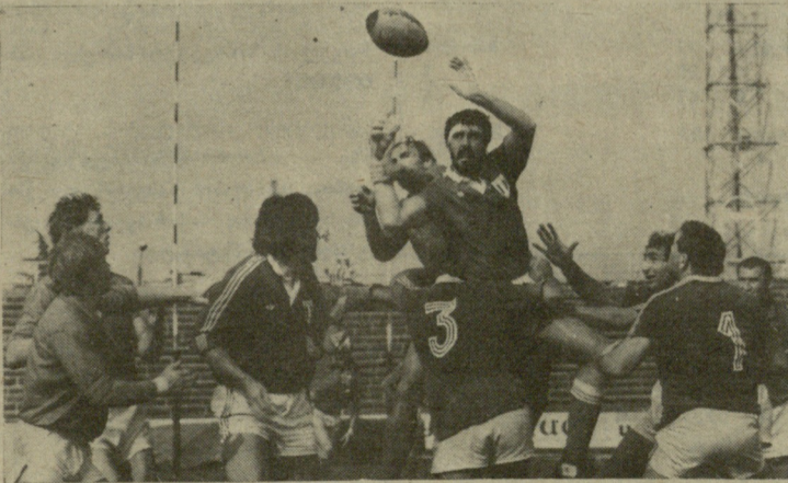
სსრ კავშირისა და საფრანგეთის ნაკრები გუნდების შეხვედრის მომენტი.