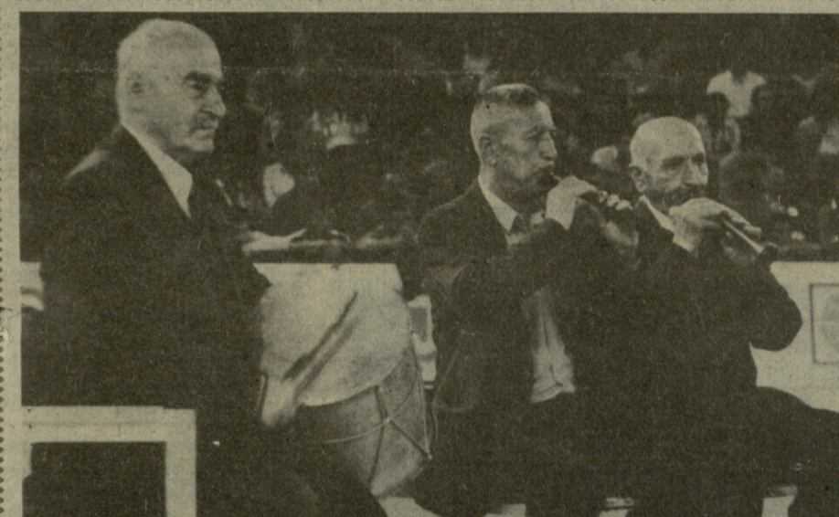
ახეთი და კიდევ უფრო ღამაში იღეთი ბევრი იხილა მსურველებმა ქართულ კლათბურთის უბნებისა და სოფლების გუნდების შეჯიბრებაზე, რომელიც საქართველოს კომპარტის ცენტრალური კომიტეტის პრიზზე ტარდება.