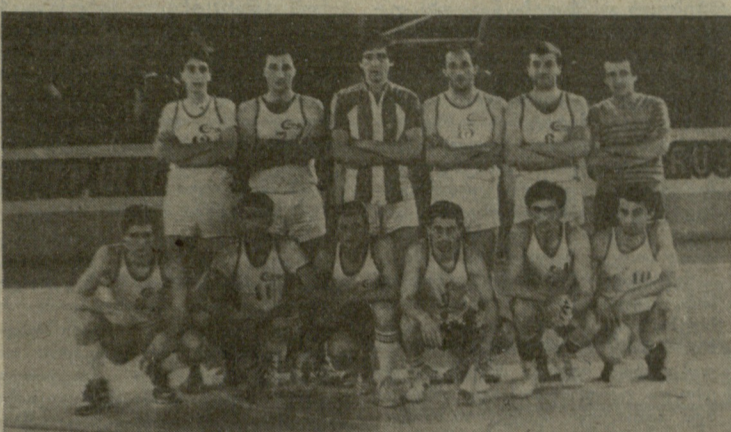
საქართველოს ფიზიკური ინსტიტუტის კლათბურთელთა გუნდი.

ფინალურ მატჩში, რომელიც უარესად მძაფრი და დაძაბული ბრძოლით აღინიშნა, საქართველო-