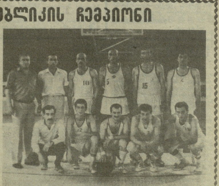
საქართველოს 1988 წლის ჩემპიონი კალათბურთში — თბილისის „სინათლე“.